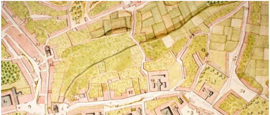
Valgada de Belvís século XVIII