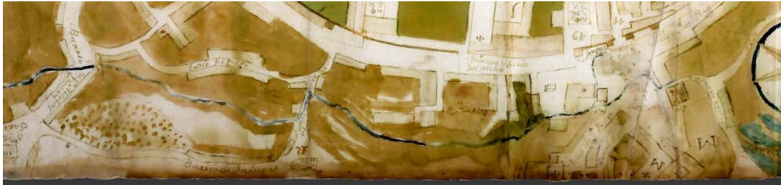
Valgada de Belvís ano 1750